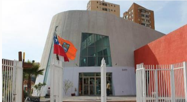
Biblioteca Sede Esmeralda