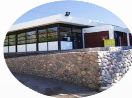
Biblioteca Antropología Museo - Azapa