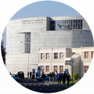
Biblioteca Central Saucache