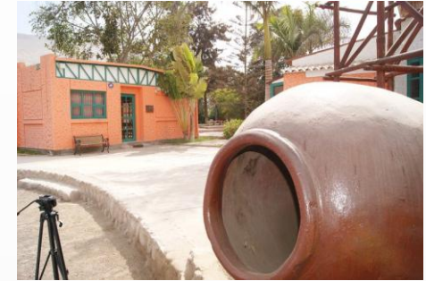
Biblioteca Agronomía Facultad de Ciencias Agronómicas - Azapa