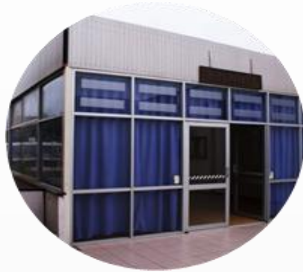
Biblioteca de Ciencias Velásquez