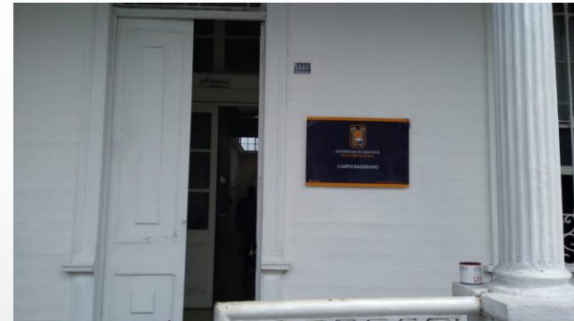
Biblioteca Sede Baquedano