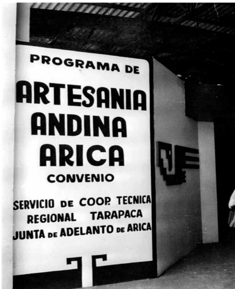
Feria de exposiciones del Programa Artesanía Andina. AHVD 428. Fondo Enrique Flores Reyes.