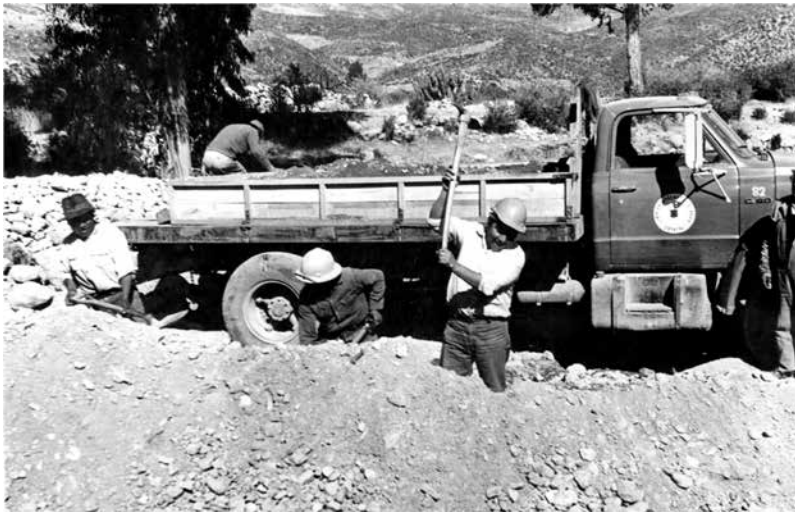
Construcción de camino sector precordillerano. AHVD 473, Fondo Enrique Flores Reyes.