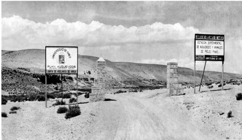
Centro experimental de pieles y manejo de ganado auquénido en Misitune. AHVD 238B. Fondo Enrique Flores Reyes.