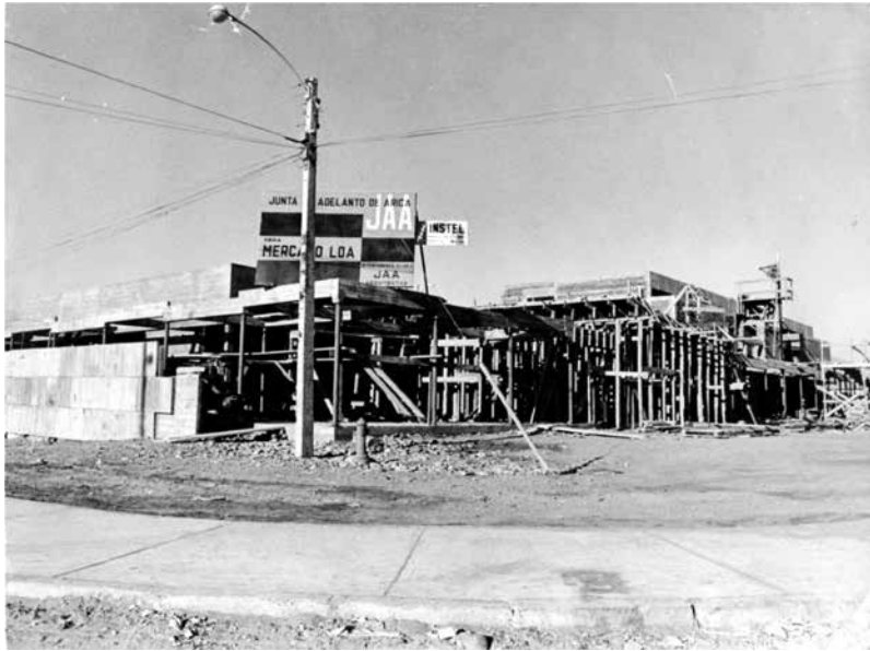
Vista de la construcción del Mercado Loa. AHVD 662. Fondo Enrique Flores Reyes.