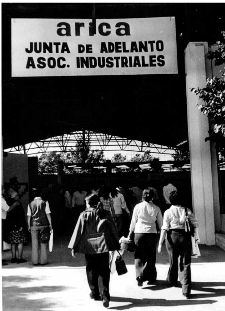
Vista Feria de Asociación de Industriales. AHVD 430.