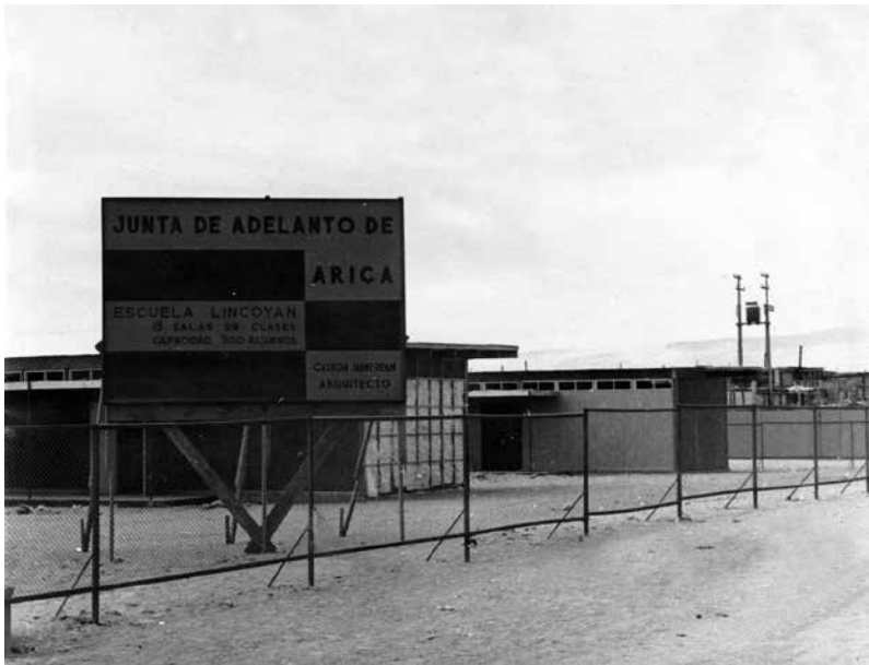
Construcción Establecimientos Educativos. Escuela Lincoyán. AHVD 724.